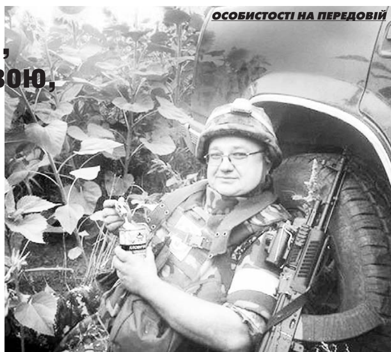
ОСОБИСТОСТІ НА ПЕРЕДОВІЙ